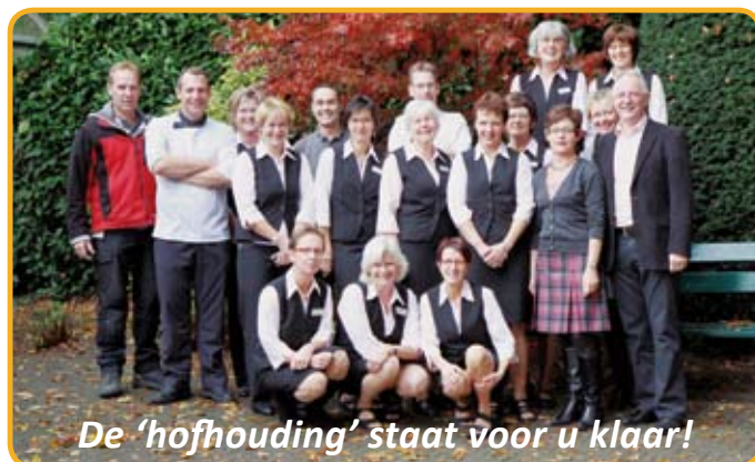
De 'hofhouding' staat voor u klaar!

We hopen u in goede gezondheid te ontmoeten.